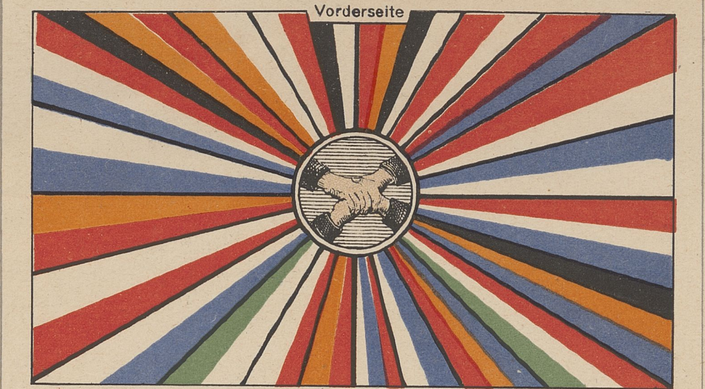
FLAGGE DER UNION