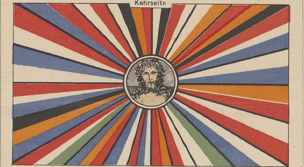
FLAGGE DER UNION