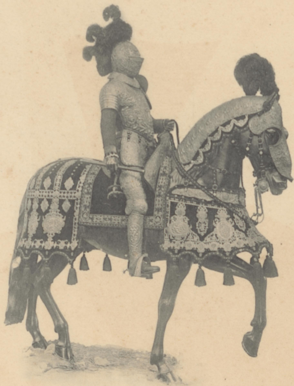
ARNÉS ECUESTRE DE FELIPE III. (1598)